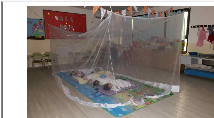
Horario de la siesta