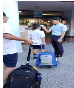
Medición de temperatura febril al ingreso